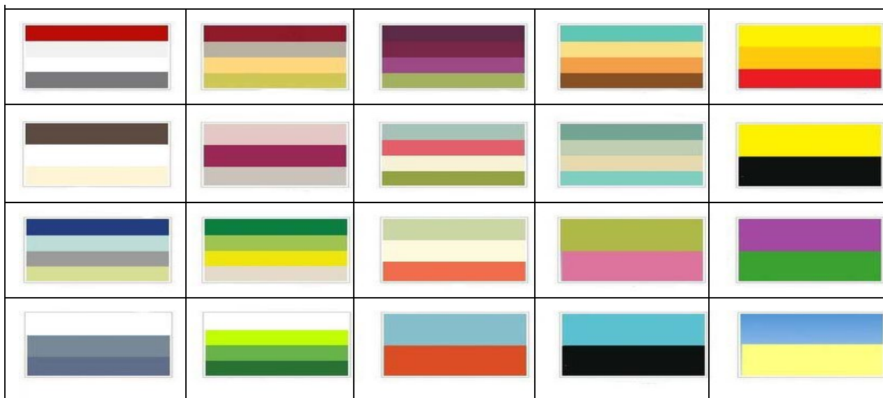
Рис.1 Кольорові композиції доцільні для готельних номерів

Важливе значення відіграє колір як засіб орієнтування гостей. Архітектор М. Я. Гінзбург, наприклад, вважав, що з цією метою різним приміщенням і навіть поверхам варто надавати різне забарвлення. Так, абсолютно не схожі один на одного майданчики поверхів будуть легко запам'ятовуються. Використання кольору як засобу орієнтування гостей особливо необхідне у великих готелях, в яких можна легко порушити експлуатаційний режим, внести суєту і безлад. Кольором можна виділити місце чергового