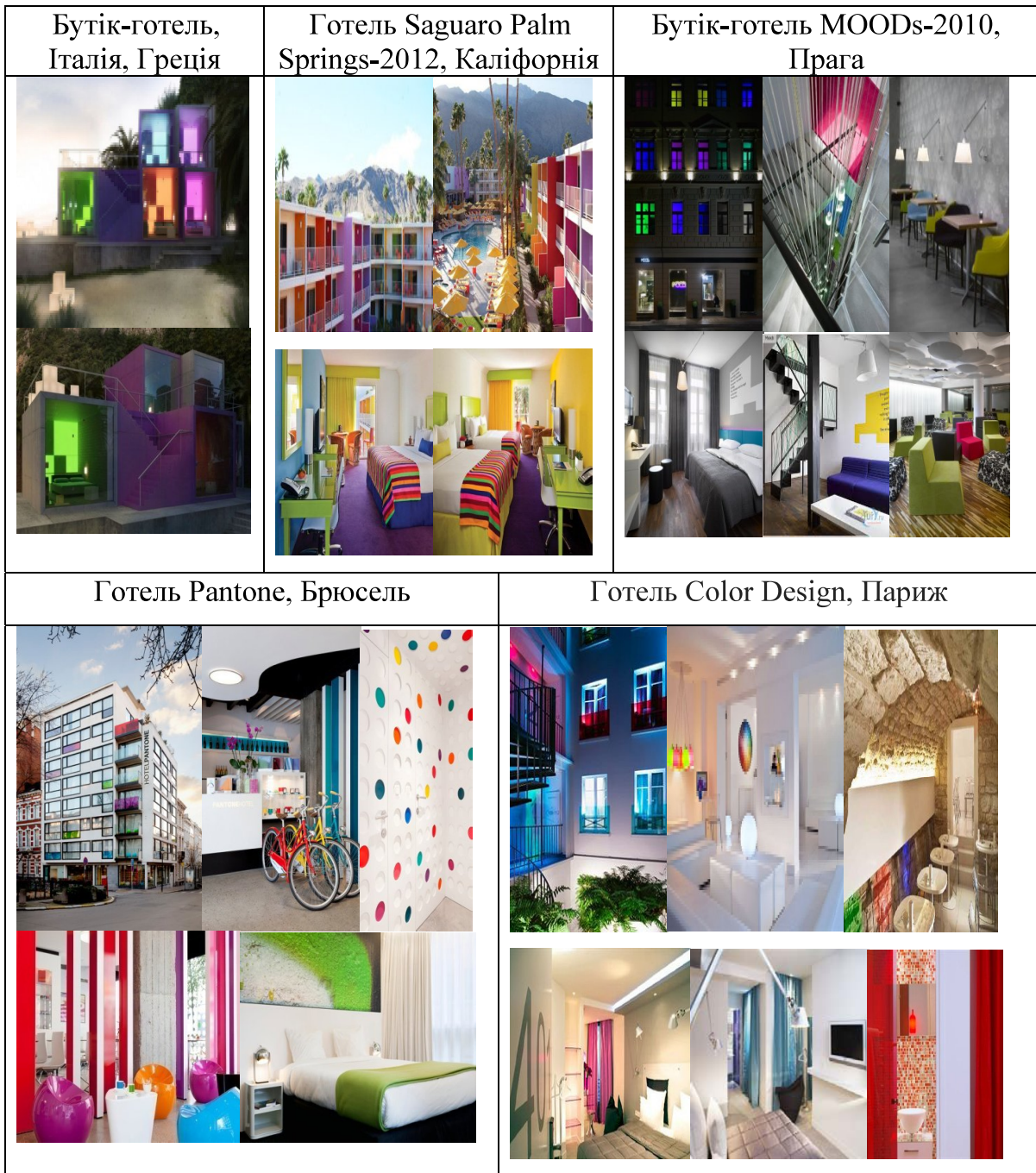
Рис.2 Застосування комбінації кольору в малих готелях