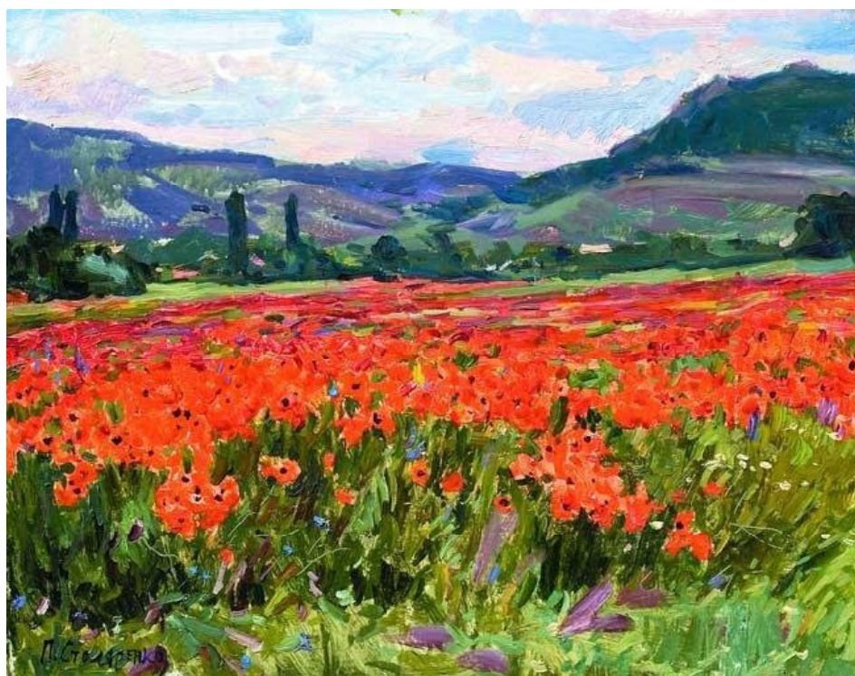
«Маки. Ялта», 1995 г. картон, масло; 40x50