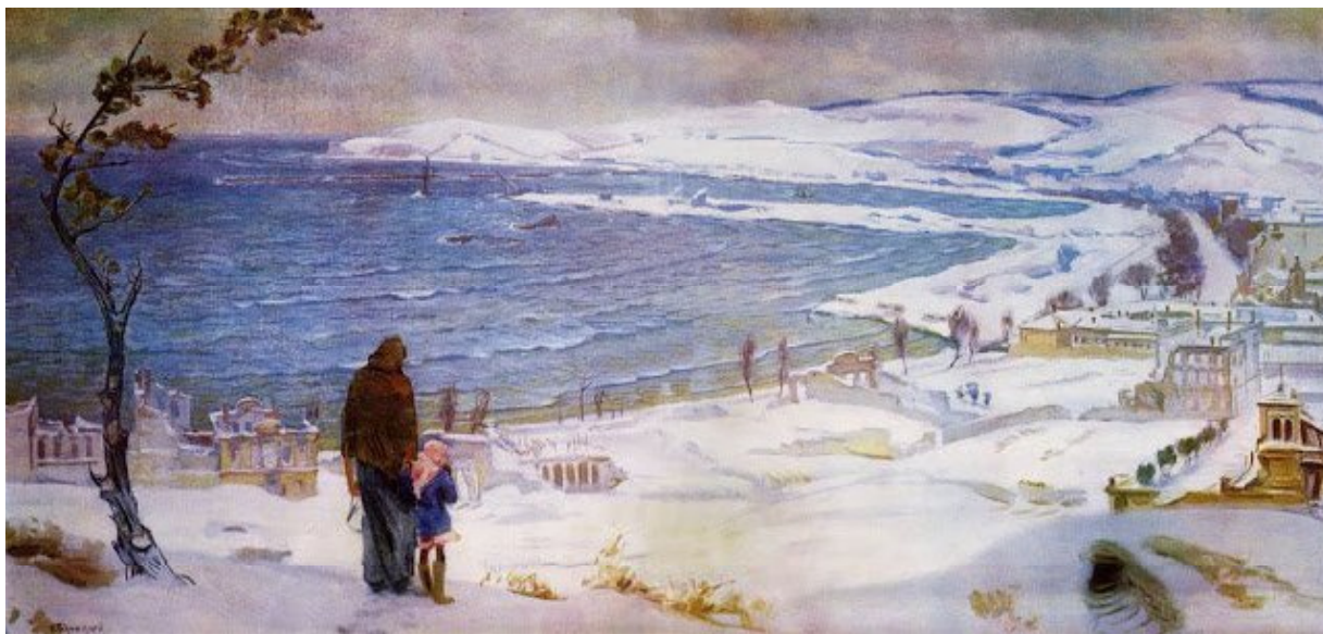
Н. Барсамов. Возвращение. 1946, х,м, 74x150 см