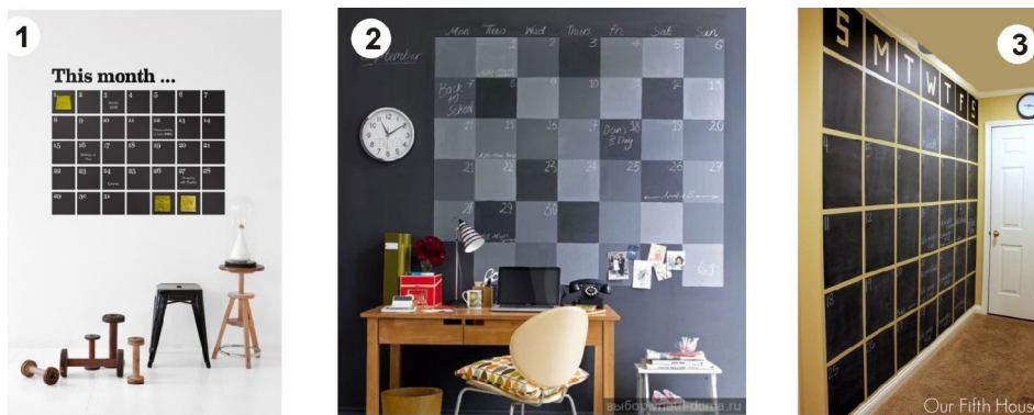
Рис. 1. Календар-розпис