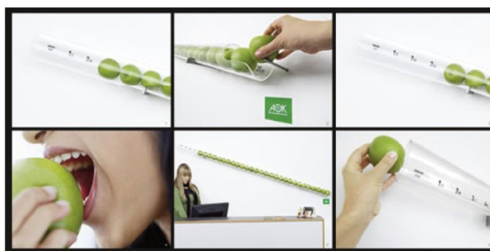
Рис. 4. Календар-інсталяція