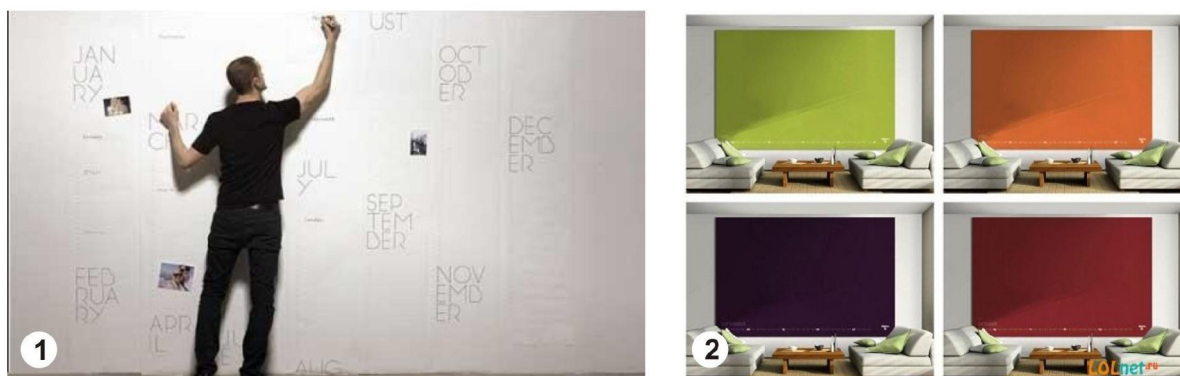
Рис. 3. Календар-шпалери