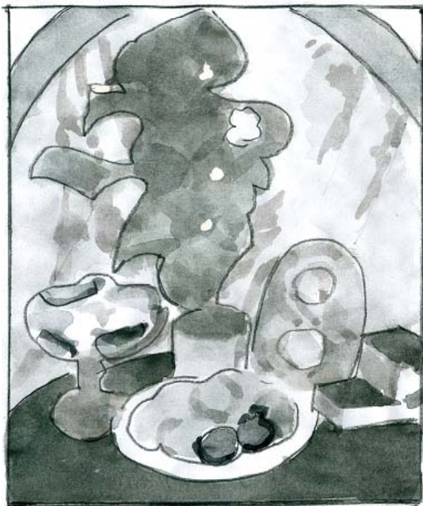
Рис. 4. Послідовне “зняття зображення”, б) у тоні

Другий етап. Виконати руйнування характеру предметів, послідовно виключаючи деталі, фактуру, характер окремих об’єктів та інше «зняття зображення». Отримаємо кольорові і тонові плями, абстрактну композицію, схему натюрморту.