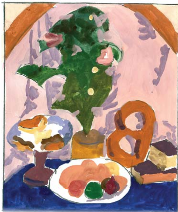
Рис. 2. Послідовне "зняття зображення", а) у кольорі