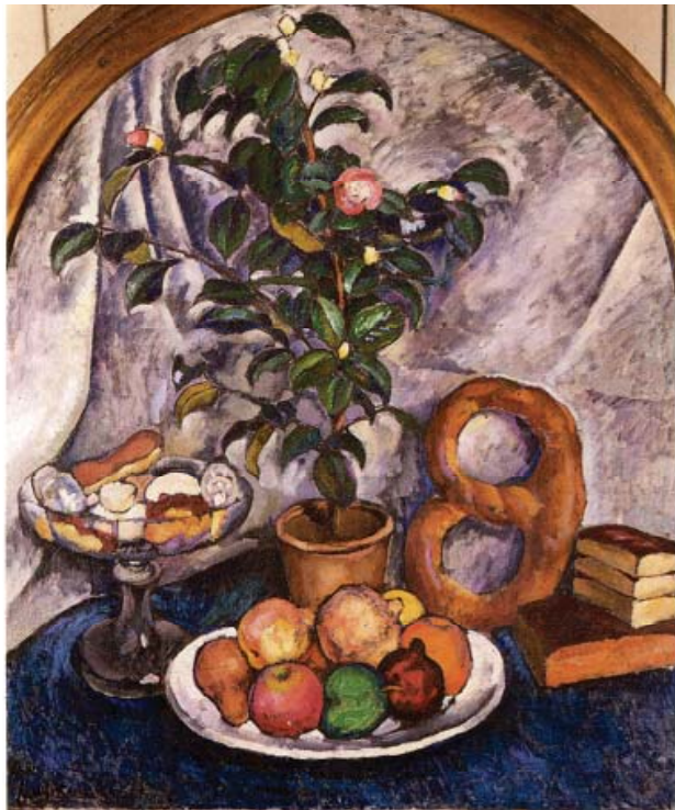
Машков І. Натюрморт з камелією, 1913р.