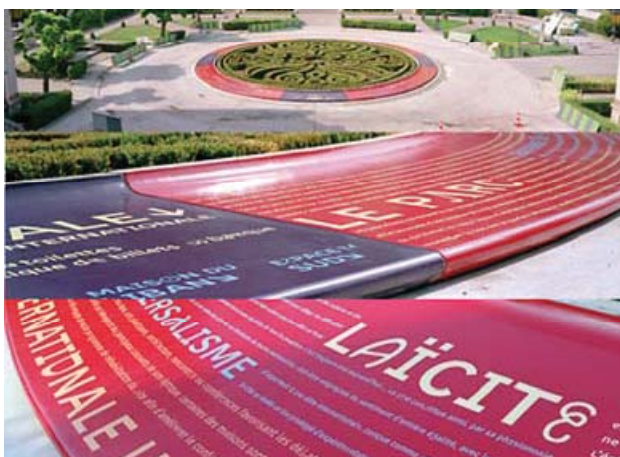
Рис. 9. Дороговказ у міжнародному університетському містечку (Париж)